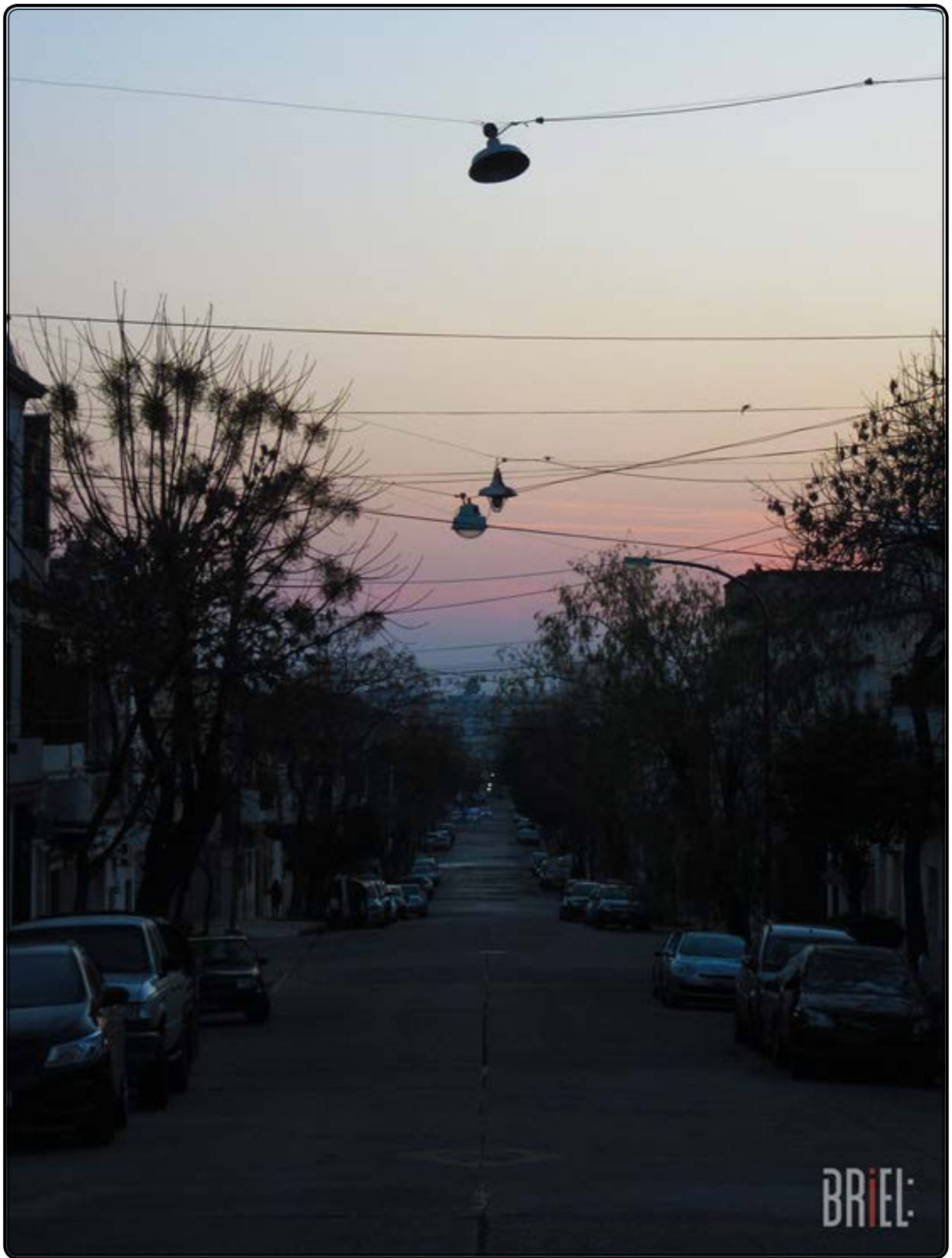
Caminos ya caminados.