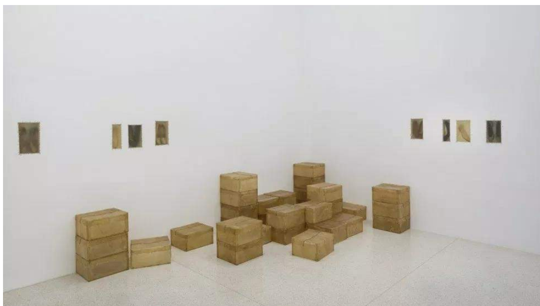
Figura 1. Atrabiliarios (Detalle). 1992-2004. Doris Salcedo. Instalación en muro con yeso, madera, zapatos, en nichos cubiertos con vitelas de animal, cosidas con hilo quirúrgico y sobre el piso cajas recubiertas con fibra de origen animal. Dimensiones variadas. Fuente: Solomon R. Guggenheim Museum (2015). Retrospective Doris Salcedo. New York, June 26-October 12. Recuperado de https://www.guggenheim.org/audio/track/doris-salcedo-atrabiliarios-1992-2004

hecho, el mismo título alude al "carácter violento" o relacionado con la "furia patológica" desatada en un hecho criminal. La artista después de realizar el trabajo de campo con familiares sobrevivientes de las personas desaparecidas y, tal vez, sobre los procesos de exhumación de restos de las víctimas, identificó como recurso creativo que los zapatos eran empleados como vestigios que permitían el reconocimiento de las personas asesinadas.