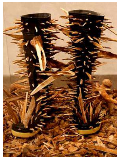
Figura 4. Emberá-Chami (Detalle). Rosemberg Sandoval. Objetos intervenidos (Botas pantaneras Venus, astillas de huesos humanos, bombillo de bajo voltaje, urna de cristal). 2008. Fuente: Ministerio de Cultura (2010b: 173). Catálogo ¡Urgente! 41 Salón Nacional de Artistas . Bogotá: Mincultura.

Desde esta lectura relacionada con los acontecimientos violentos, los restos humanos punzantes, fueron “recolectados en fosas comunes de diferentes poblaciones colombianas afectadas por la violencia” (Diago, 2008). Es decir, que los fragmentos físicos de “ Emberá-Chami ” indican que fueron presencias vitales, existencias ubicadas y ahora ausentes (Krauss, 2006, págs. 220-222). También señalan los rastros de la muerte y destrucción donde se instalaron los pies de los perpetradores. Al mismo tiempo, connotan la manera como el cuerpo social de los colombianos se desintegra desde el interior, produciendo múltiples vacíos y traumas.