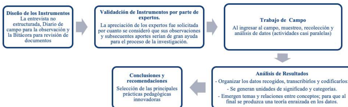
Figura 2. Etapas del desarrollo metodológico de la investigación

actitudes que perciben los docentes de los estudiantes durante las actividades que proponen en clase y, desde la perspectiva de docentes y estudiantes, cómo se deberían innovar las prácticas pedagógicas, de manera que se motive el aprendizaje, se aumente la disposición y el interés de los estudiantes, y si consideran que la innovación en estas y en el seguimiento a los aprendizajes permitirá un mejoramiento significativo de los resultados en las pruebas evaluativas.