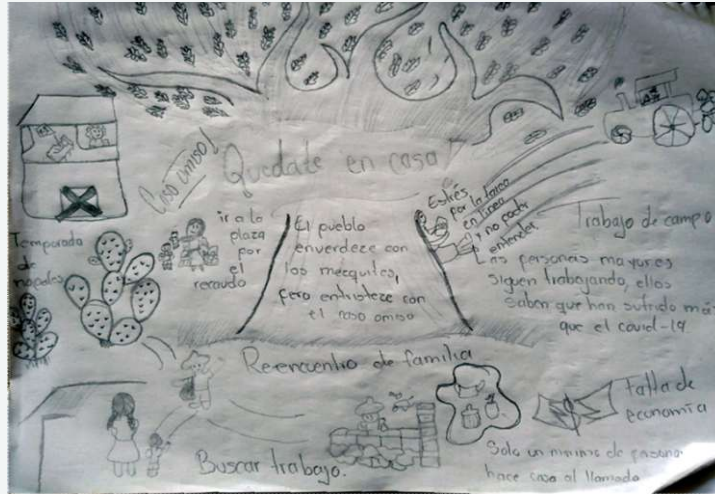
Figura 3 Cartografías pandémicas