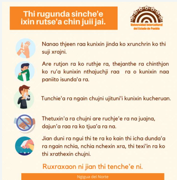
Figura 6 Medidas de precaución ante COVID-19 en lengua ngigua