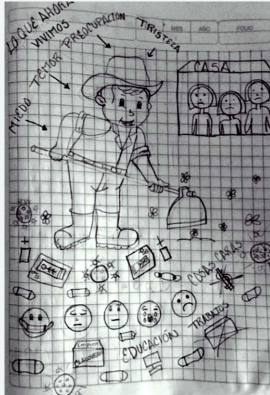
Figura 5 Cartografías pandémicas