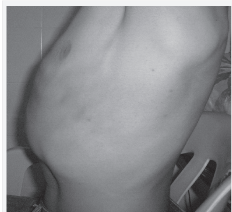
Figura 2. Tórax en Tonel.