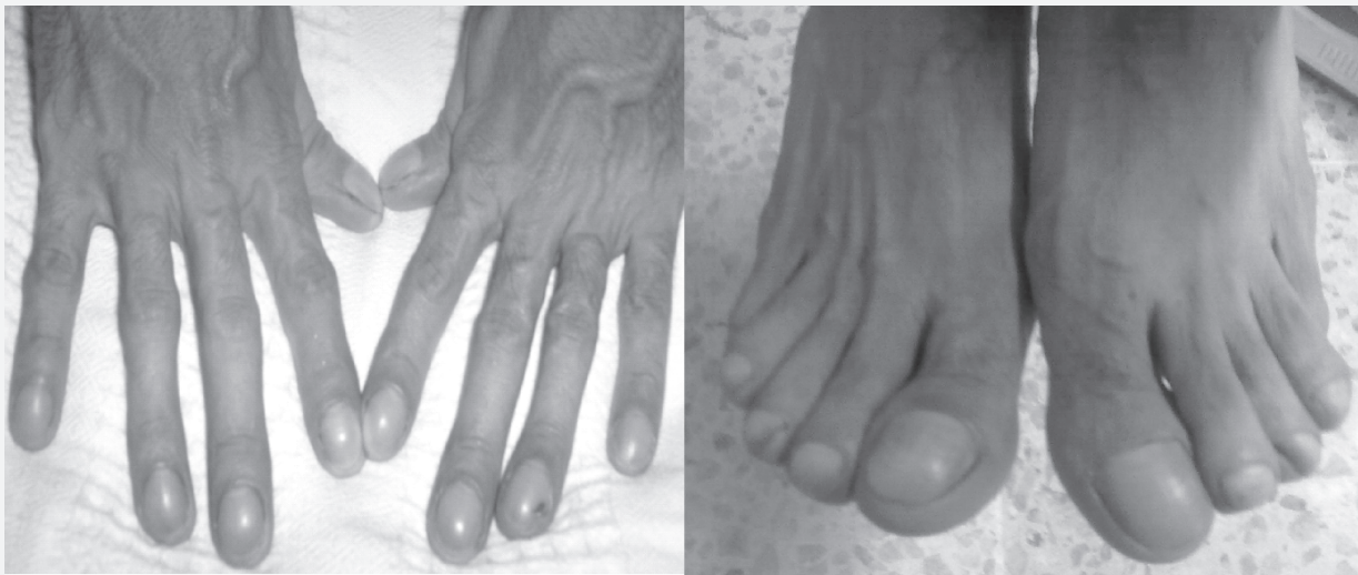
Figura 3. Hipocratismo digital en miembros superiores e inferiores.