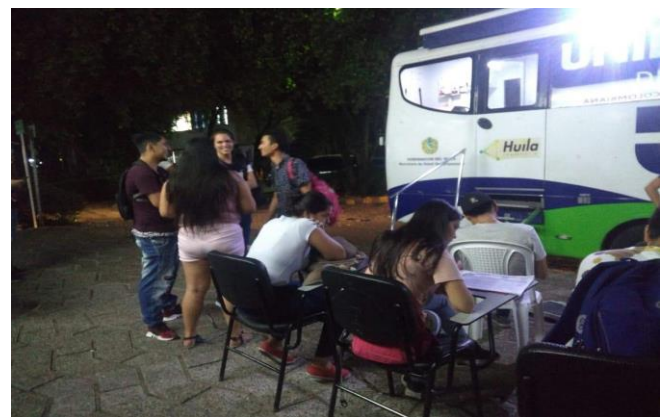
Figura 2. Jornadas de capacitación desarrolladas en recinto universitario.

Para las actividades de difusión, promoción e impulso de la donación voluntaria de sangre, se desarrollaron capacitaciones en temáticas relacionadas con infecciones de transmisión sexual y prevención del consumo de sustancias psicoactivas a 290 personas (Ver Figura 2).