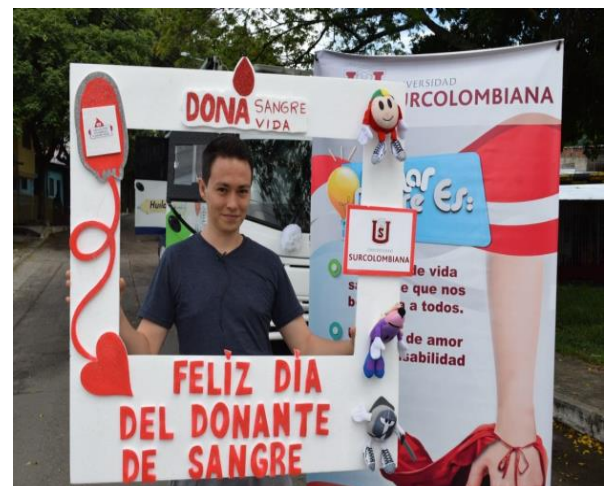
Figura 4. Día del Donante, 2020.

Con lo anterior se consolidaron estas significativas experiencias en un encuentro de celebración, en el marco del día mundial del donante voluntario de sangre (Junio 14), entregando además incentivos y agradecimientos en los domicilios de cada uno de los donantes (Ver Figura 4).