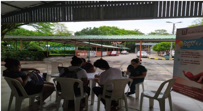
Figura 3. Jornadas de Donación Voluntaria de Sangre

acompañadas de 3 actividades realizadas con la emisora Universidad Surcolombiana y el desarrollo del II Congreso internacional de proyección social.