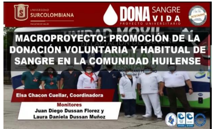
Figura 1. Pieza audiovisual programa Donación Voluntaria de Sangre.

Con el proyecto se realizaron 10 jornadas móviles de donación en 8 universidades del Departamento del Huila con un porcentaje de ejecución del 41.6%, obteniéndose 366 unidades de sangre que permitieron proporcionar atención terapéutica a los pacientes que la requieran. De igual manera, se realizaron 26 sesiones educativas virtuales mediante la plataforma Google Meet, acompañada del desarrollo y presentación de una pieza audiovisual (Ver figura 1).